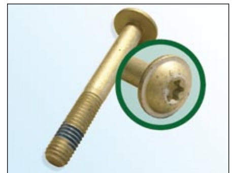
Fot. 3: Śruba LuK

LuK zaleca wymianę oryginalnej śruby (fot. 2) na nową z dostarczonego kompletu.