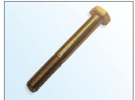
Fot. 2: Śruba OE

W ramach ciągłego rozwoju naszych produktów i w celu zapewnienia ich wysokiej jakości, napinacz 531 0278 30 dostarczany jest wraz z nową śrubą (fot. 3).