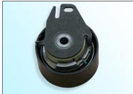
Fot. 1: wariant OE

Wskazówka: Producent pojazdu dopuszcza oba typy na pierwszy montaż. Montaż i regulacja napięcia paska przebiega zgodnie z instrukcją producenta pojazdu.